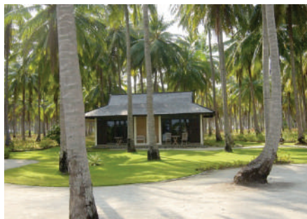
Bungalow op Menyawakan Eiland

Verder is er op het eiland Menjangan Kecil een mogelijkheid om te zwemmen met witpuntrifhaaien.