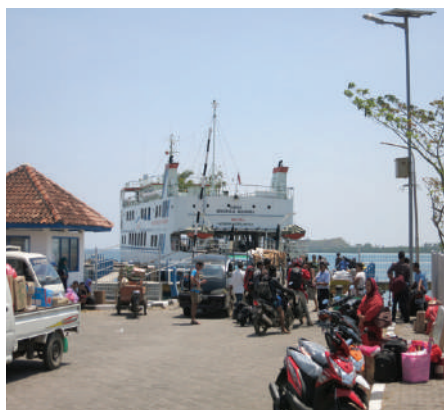
Vertrek van de ferry naar Jepara

Voor de liefhebber van snorkelen of scubaduiken zijn er op Java niet zoveel mogelijkheden. De zuidkust is over de hele linie genomen te gevaarlijk door de heftige golfslag en de sterke onderstromingen die de Indische Oceaan nu eenmaal kent. Bij Pangandaran zijn wat mogelijkheden om te snorkelen, maar echt indrukwekkend is het niet. Aan de Westkust van Java leent het natuurpark Ujung Kulon zich wel goed voor snorkelen, vooral bij het eilandje Peucang, maar hier is de bereikbaarheid een probleem plus dat een 'permit' nodig is. Bij de eilanden groep Pulau Seribu, ten noorden van Jakarta, zijn redelijke snorkel en duikmogelijkheden maar druk en duur door de vele Jakartanen en expats die er hun vrije dagen slijten. Het water is er niet overal schoon. Snorkelen zou nog kunnen bij het mini-badplaatsje Pasir Putih, aan de noordkust voorbij Surabaya, maar hier is de accommodatie weer erg matig.