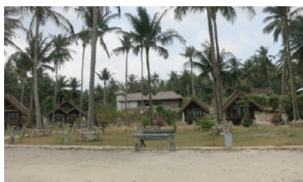
Strand bij Ary's Lagoon